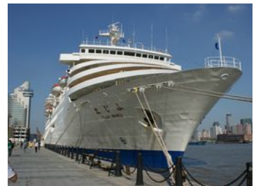
<生産性の船は、1971年より実施し、これまで125船を派遣し、団員総数は51,660名にのぼります>

日本を離れることで、高く広い視野をもって自分の人生、キャリア、仕事のことを見つめてみましょう。日本、アジアの働く女性として、素敵な生き方を仲間と一緒に探しましょう！